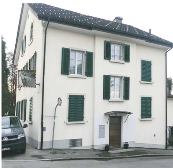
In diesem Haus an der Falkenstrasse 6 wuchs Edwin Stiefel auf.