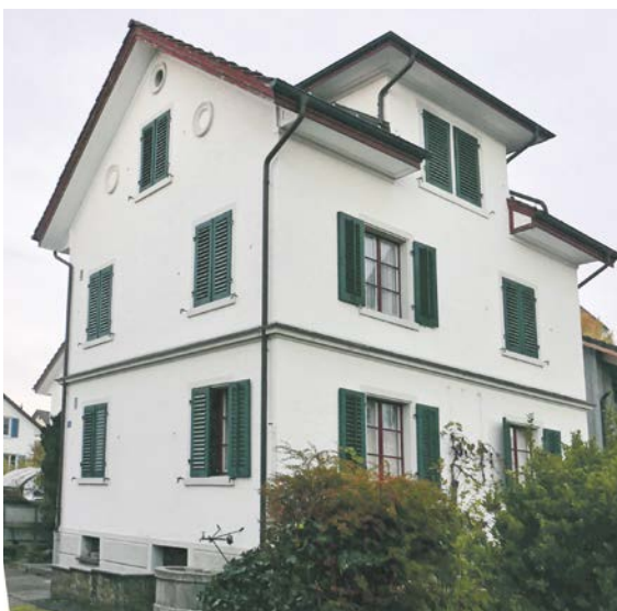
An der Daheimstrasse 2 in Tann hat das Ehepaar Stiefel viele Jahre lang gewohnt.