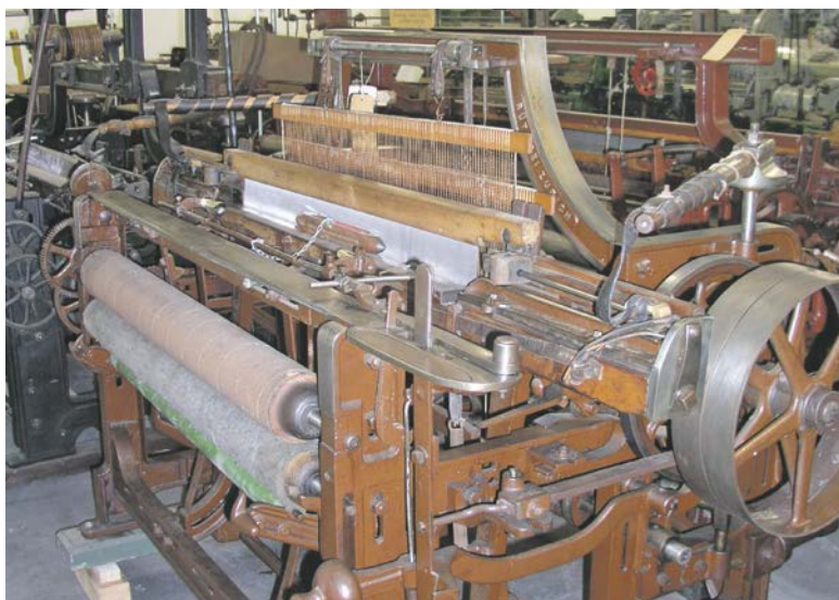
Honegger Webstuhl von 1860.