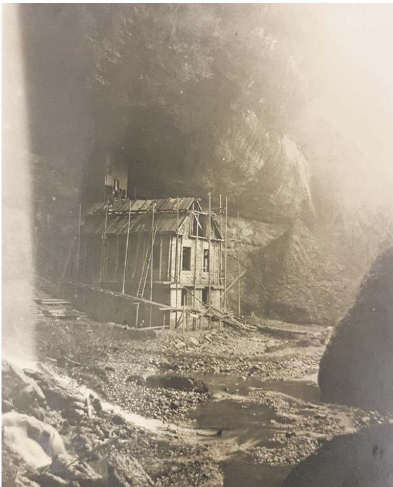
Bau des Kraftwerkes und der Hohlauf 1918.

Der Betreiberverein «Unternehmen Dürnten – Verein zur Förderung ökologisch nachhaltiger Ziele» hat, getreu seinem Motto, die Montage des umweltfreundlichen Stromerzeugers ohne grössere bauliche Eingriffe zu Wege gebracht und auch der Wasserabfluss am Standort wird nicht beeinträchtigt.