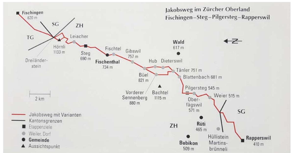
Jakobsweg von Steg nach Rapperswil: Quelle Büchlein Pilgerwege der Schweiz, Zürcher Wanderwege.

https://jakobsweg.ch/de/eu/ch/weg/konstanz-einsiedeln/steg-rapperswil/ Webseite Jakobsweg