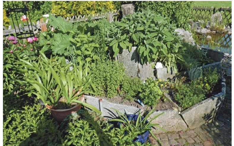
Kräuter, frisch vom Garten.

Nach dem Auszug der Kinder wurde noch einmal vieles anders. Das Biotop mit kleinem