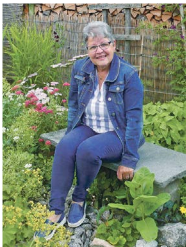
Gärtnern macht glücklich.