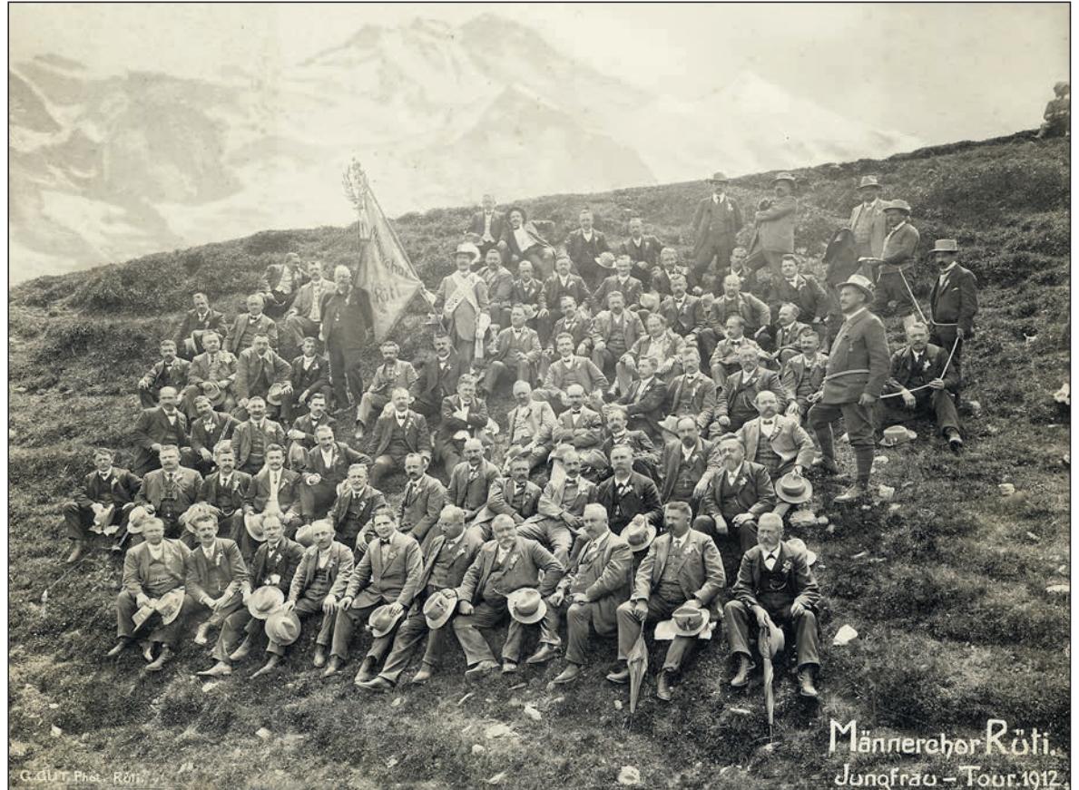
Der stolze Männerchor Rütli auf der Jungfrau-Tour nach dem Eidgenössischen Sängertag in Neuenburg.

Der Frühling zog schon Mitte Februar ein. Die Amseln flöteten morgens und abends. Auf Wiesen und in Gärten blühten Blümlein. Mühsam war das Wetter im Mai! Am einen Tag fast tropische Hitze, am andern Tag wieder Schnee bis in die Niederungen mit Temperaturen zum Schlottern. Am 1. August brach der grosse Regen los. Ein Platzregen zerstörte die 1.-August-Feierlichkeiten. Starke Regenfälle den ganzen August hindurch erschwerten es, Heu und Emd sowie das Getreide unter Dach zu bringen. Viele tausend Zentner Emd verfaulten auf den Wiesen. Der Herbst versprach einen reichen Obstsegen. Schwer behangen waren die Apfel- und Birnbäume. Dem nasskalten Sommer folgten Mitte Oktober schon wieder die Ernte störende Schneefälle, und an Martini hielt der Winter endgültig Einzug. In der Würzhalden und auf Riedern brach im Mai, wahr-