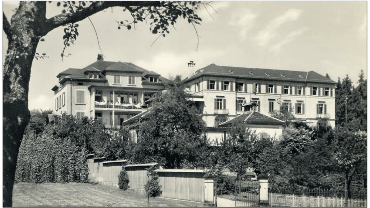
Rütli Krankenhaus (v. l. n. r.) der 1912 erstellte Neubau, der 1912 renovierte Altbau, im Vordergrund das 1904 erstellte Absonderungshaus.