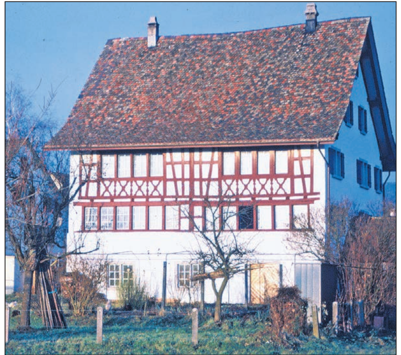
Riegelhaus, Dürnten, von Süden, 1983, nach der Renovation.