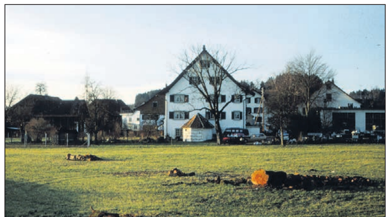
Gerodeter Baumgarten westlich des Riegelhauses, heute Gebiet der Etzelstrasse, 1983.

Staatsarchiv (Plan 1685) Heimatspiegel 07/1979 (Text; Foto Fallladen-Fenster) Denkmalpflege des Kantons Zürich (zwei Schwarzweissfotos 1971) Dia-Sammlung W. Baumann