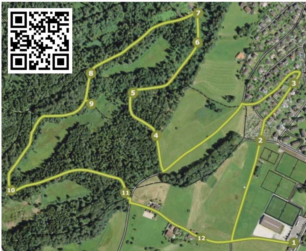
Situationsplan Naturlehrpfad Rütiwald/Alpenblick/Sportplatz. Reproduziert swisstopo (BA 20005)

Am Samstag, 16. Mai, wäre der Naturlehrpfad im Rütiwald eingeweiht worden – die Festivitäten werden auf später verschoben