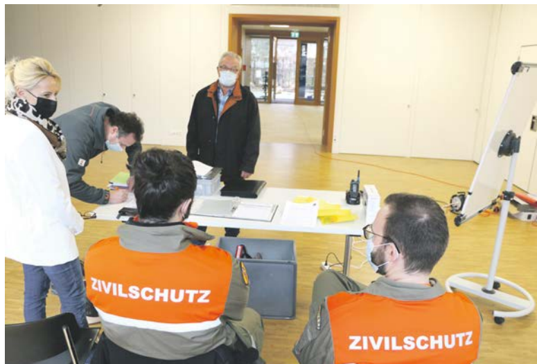
In Rüti befindet sich der Notfalltreffpunkt im GZ 31 (Werkstrasse 31)

Der Regionale Führungsstab Bachtel hat erstmals die neuen Notfalltreffpunkte in den Gemeinden Bäretswil, Bubikon, Dürnten, Hinwil und Rüti in Betrieb genommen. Ein wichtiger Test, der durchs Band glückte.