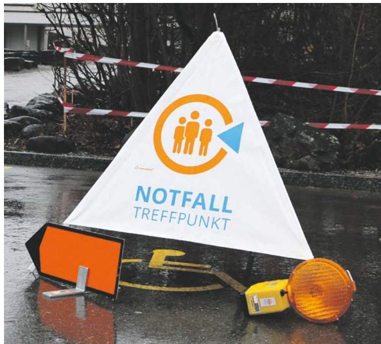
Der Weg zum Notfalltreffpunkt - wurde gut ausgeschildert.

Seit Ende 2021 verfügt auch der Kanton Zürich über Notfalltreffpunkte. Solche beispielsweise in einem Schulhaus oder Werkhof eingerichteten, einfachen Anlaufstellen, von denen es idealerweise in jeder Gemeinde mindestens eine geben sollte, werden bei Katastrophen oder in ausserordentlichen Lagen wie einem länger dauernden Stromausfall in Betrieb genommen. Die Bevölkerung kann sich dann dort trotz des Ausfalls wichtiger Infrastrukturen wie dem Telefonnetz in einem geschützten Rahmen direkt informieren, Hilfe anfordern, allenfalls auch Nahrung und Hilfsgüter beziehen.