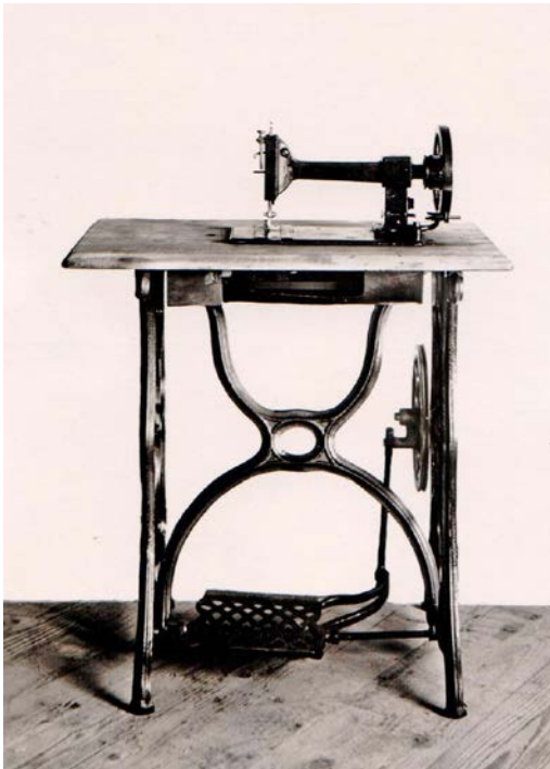
1945 in der Festschrift verewigt -- die «älteste Schweizerin».