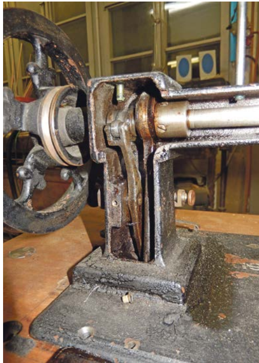
Da gab es für den Restaurator viel zu tun!