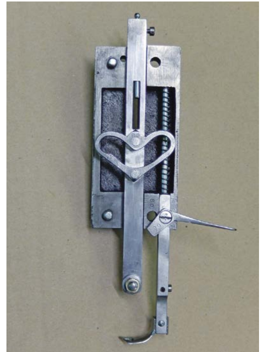
Jedes Teilchen ist von Hand gefertigt.