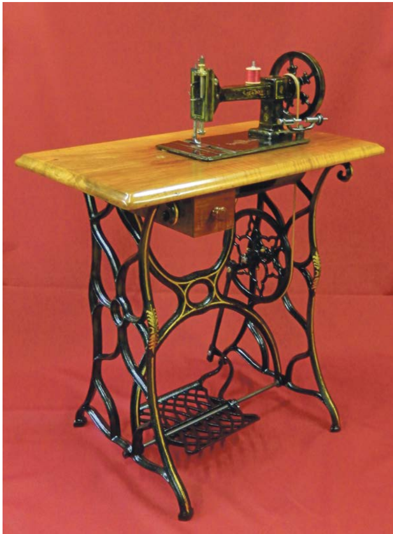
In Schönheit Wiedergeborene...

Viele Jahre später im Museum an der Walderstrasse: Hier präsentieren Roni Schmied und Tino Jaun