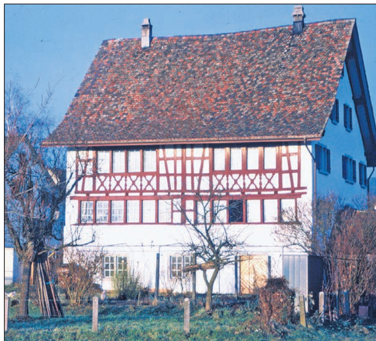
Riegelhaus, Dürnten, von Süden, 1983, nach der Renovation.