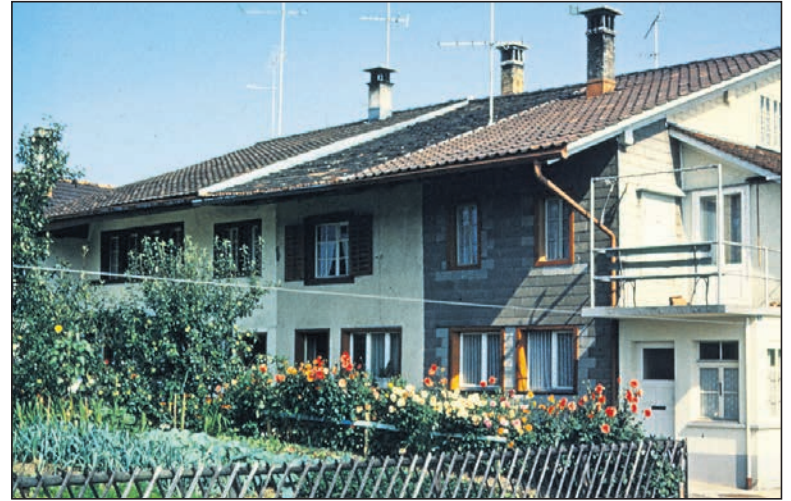
Flarzhäuser, Gartenrain, Tann, 1971; individuelle Gestaltung!

Die einst zum Kloster Rüti gehörenden Höfe wurden nach der Reformation von der Stadt Zürich übernommen und dem Amtmann im Amthaus Rüti unterstellt. Im Jahr 1685 wurde der dazugehörige Hof von «Under Dürnten» auf einem Plan festgehalten. Ein Teil davon ist hier abgebildet. Man sieht darauf alle Gebäude des da-