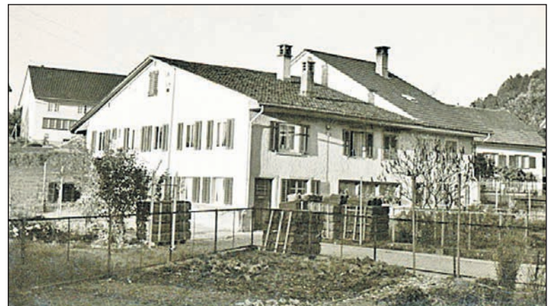
Flarzhäuser, Hinterdorf Dürnten, 1971 noch mit vielen Vorgärten.