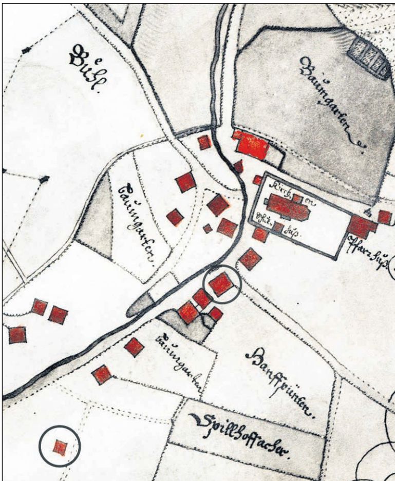
Plan des Dorfes Dürnten, 1685.

Bei Erbteilungen bauten die Erben unter dem gleichen Dach seitlich neue Teile an. Der zum Haus gehörende Anteil an Ackerland, Heuwiesen, Weiden und Wald wurde damit für jeden verkleinert. In der Not unterteilten die Geschwister grössere Gebäudeteile auch einfach durch eingezogene Zwischenwände, um ihrer neuen Familie Platz zu machen. Mit der