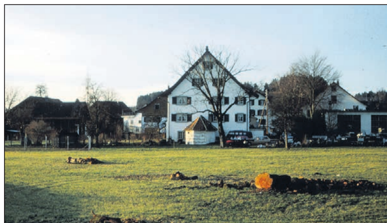
Gerodeter Baumgarten westlich des Riegelhauses, heute Gebiet der Etzelstrasse, 1983.

Staatsarchiv (Plan 1685) Heimatspiegel 07/1979 (Text; Foto Fallladen-Fenster) Denkmalpflege des Kantons Zürich (zwei Schwarzweissfotos 1971) Dia-Sammlung W. Baumann