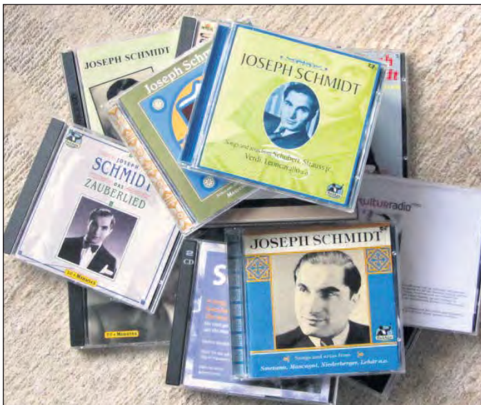
Die Stimme Schmidts ist auf einer reichen CD-Auswahl zu hören.

Die neu herausgegebene Biografie aus dem Römerhof Verlag Zürich kann im Buchhandel oder beim Autor bezogen werden. Alfred A. Fassbind: Joseph Schmidt – Sein Lied ging um die Welt, 336 Seiten, 44 Franken, ISBN 978-3-905894-14-1, mit zahlreichen Abbildungen und CD. (Kontakt: alfredfassbind@hispeed.ch oder Telefon 055 240 33 35.)