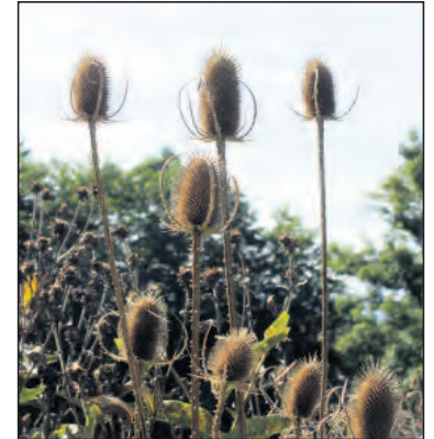
Karden: beliebt beim Stiglitz, der eben auch Carduelis heisst!

Boden. Man kann auch Gründüngung einsäen (September, Oktober), was ein sehr effizienter Dünger ist.