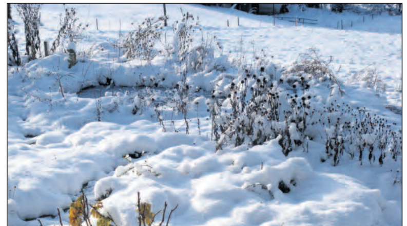
Je vielfältiger die Samen, desto vielfältiger die angelockte Vogelschar.