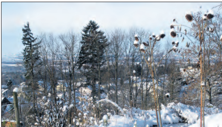
Verblühte Sonnenblumen als Blickfang.