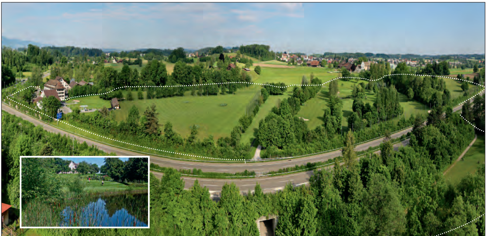
Der Golfplatz Bubikon im Mai 2012 aus der Vogelperspektive. Im kleinen Bild eines der vielen Biotope.

«Bubikon – Golf für alle» kann zu einem Spezialpreis von 50 Franken im Clubhaus des Golfplatzes und bei der Papeterie Köhler in Rüti gekauft werden.