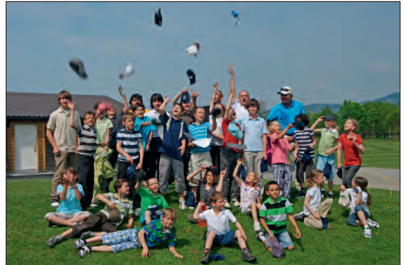
Nur zufriedene Gesichter am Frühlingscamp für Jugendliche.