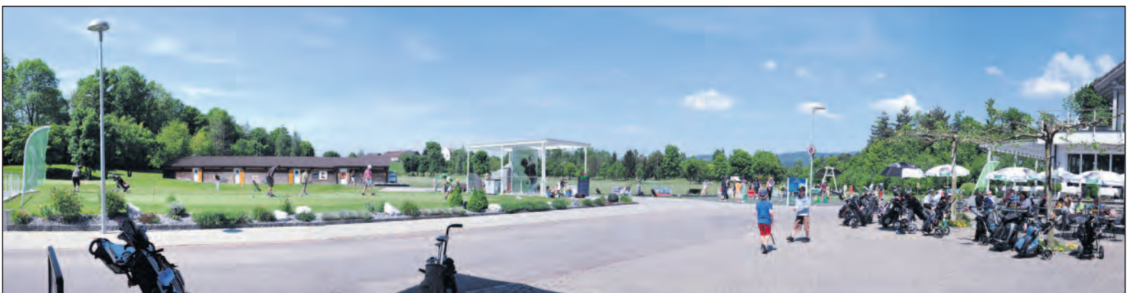
Die Driving Range erfreut sich grosser Beliebtheit. Obwohl sehr gut frequentiert, gibt es in Bubikon auch an Wochenenden keine Wartezeiten.