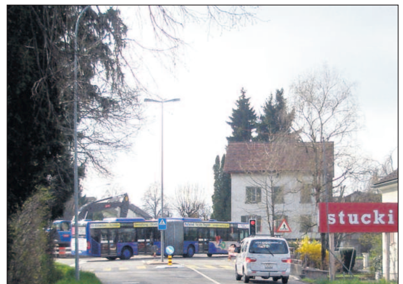
In der Baugrube sind die vielen Röhren und Leitungen sichtbar: für Wasserversorgung, Kanalisation, Elektrizität und Gas, Strassenbeleuchtung, Telefon- und Fernsehempfang. Die Umfahrung der grossen Baustelle verlangte von den Chauffeuren einiges Geschick.