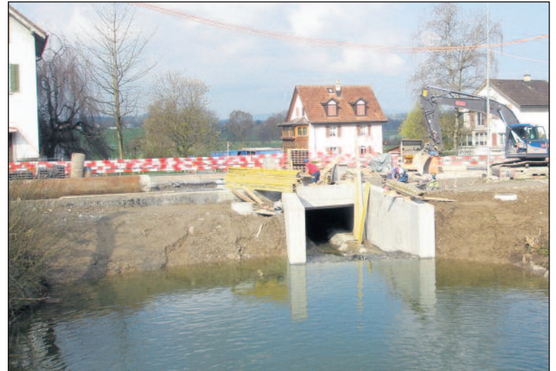
Der Kiessammler musste zur Hälfte trockengelegt und das Wasser des Nauenbachs in die alte Röhre geleitet werden, bis der Durchlass und sein in den Weiher ragender Einlauf betoniert waren.

lichen lösten dabei schwierige Aufgaben.