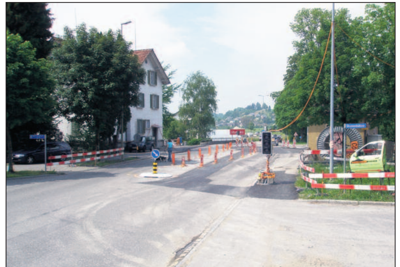
Der Durchlass des Nauenbachs ist fertiggestellt und überteert. Die beiden Fahrstreifen sind wieder offen. In der Mitte ist die lange und breite Mittelsinsel markiert. Alles ist noch provisorisch festgelegt und wird erst nächstes Jahr fertiggestellt.