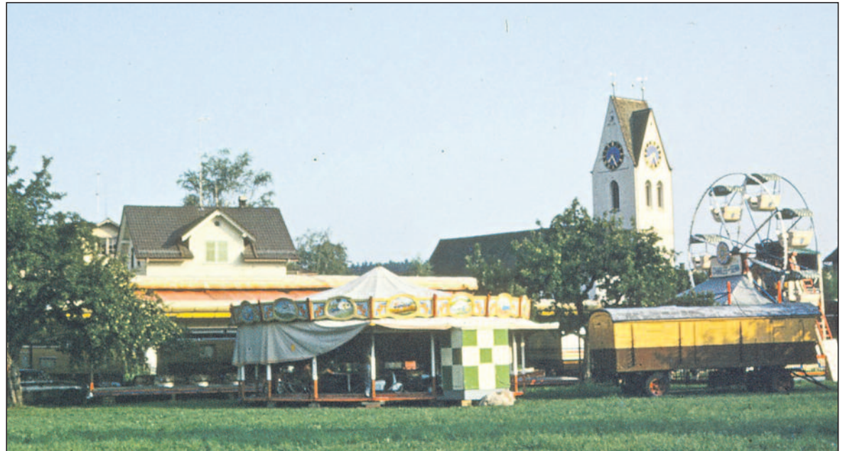
Einige Jahre standen die Rössli-Reitschule und weitere Chilbieinrichtungen, hier auch ein Riesenrad, auf der Pfarrwiese (Foto ca. 1973).

Ab den 1920er Jahren stand jährlich einmal zwischen dem «Löwen» und der «Löwen»-Scheune (heute Volg-Laden und Arztpraxis) eine Rössli-Reitschule.