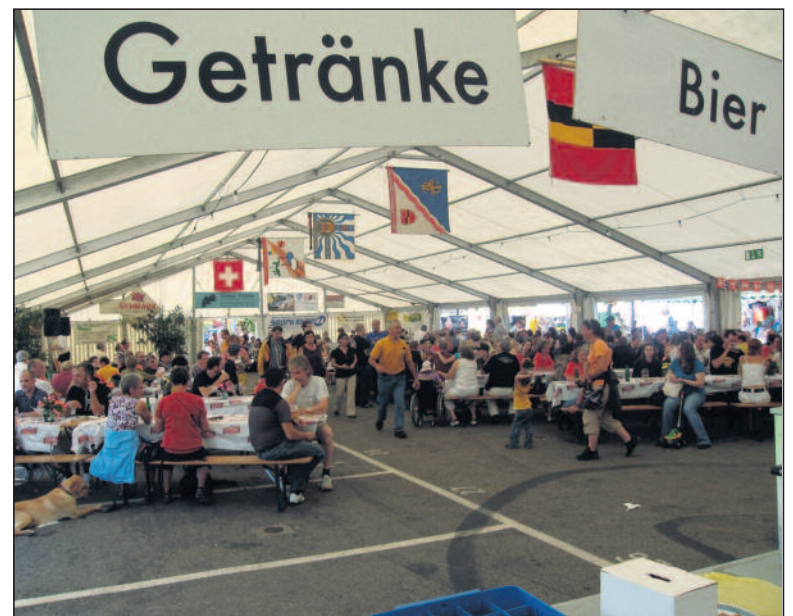
Aufstellen und Abbruch der grossen Halle samt Einrichtungen bedingen den Einsatz von vielen Vereinsmitgliedern.