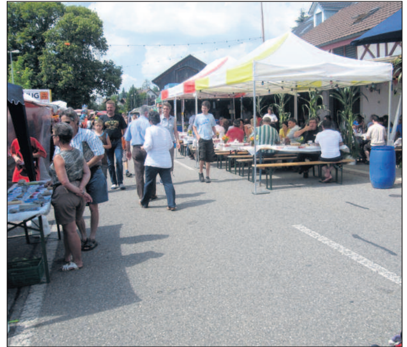
Das Feuerwehrhäuschen und die Vorbauten bis Mitte Strasse werden ebenfalls rege genutzt.

Am 13./14. August 1988 stand das erste Chilbi-Zelt neben Karussell und Autobahn. Auch im Feuerwehrlokal war eine Wirtschaft eingerichtet. Die Oberdürntnerstrasse durfte für den Durchgangs-