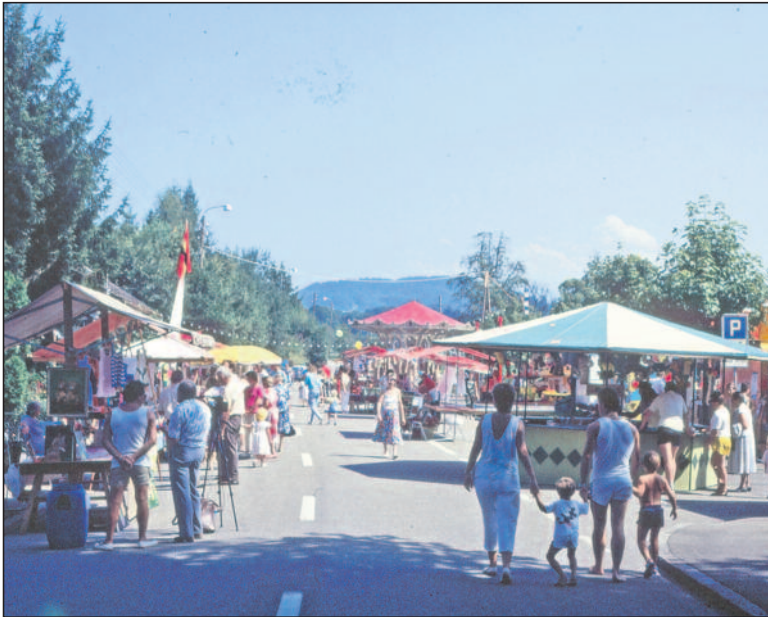
Ein Jahr später ein ganz anderes Bild: Marktstände säumten die Oberdürntnerstrasse. Der Schausteller installierte wieder mehrere Bahnen, und die Vereine bewirteten die Gäste in einem kleinen Festzelt und im Feuerwehrlokal.

Zivilgemeinde lieferte den Strom gratis gegen eine Anzahl Freibillette für die Schüler von Dürnten.