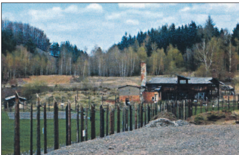
Das Lager von aussen, im Hintergrund eine erhaltene Werkstatt.

Leopoldov war auch als Prominentengefängnis bekannt. Hier wurden prominente Staatsfeinde gefangengehalten: Politiker der ersten Republik und des Protektio-