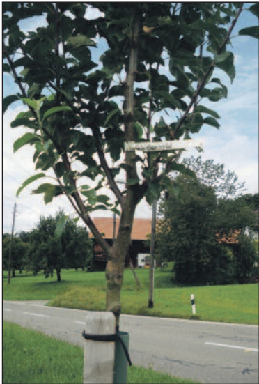
Einer der Glockenäpfelbäume.

hauptsächlich Landschaftspflege betreiben möchten. Zudem findet er es absurd, Obst von weither zu transportieren, wenn es hier doch auch gedeiht. Mit der Produktion von einheimischem Obst leistet er einen Beitrag an den Klimaschutz und hilft, den Energieverbrauch und den CO 2 -Ausstoss zu reduzieren. Also eine lobenswerte Haltung! Zu hoffen ist, dass der Tat Erfolg beschieden sein wird.