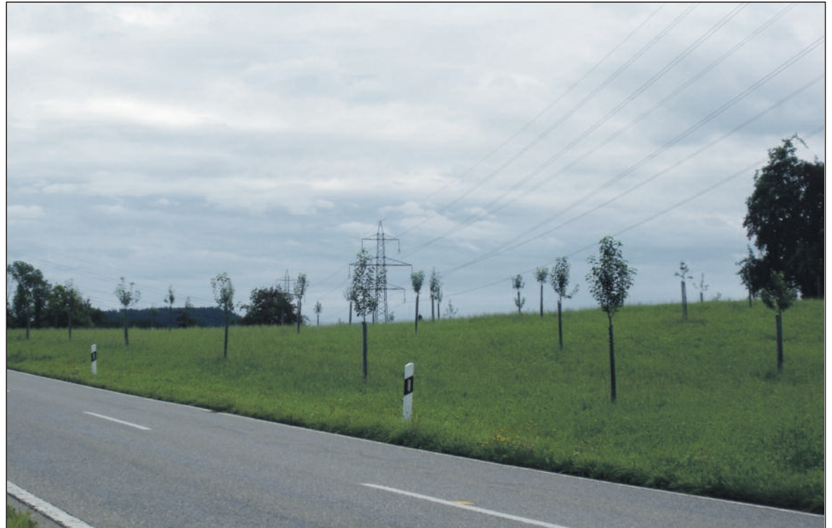
Die neuen Obstbaumreihen zwischen Dürnten und Oberdürnten.

In früheren Jahren stand auf dem jetzt neu bepflanzten Land schon