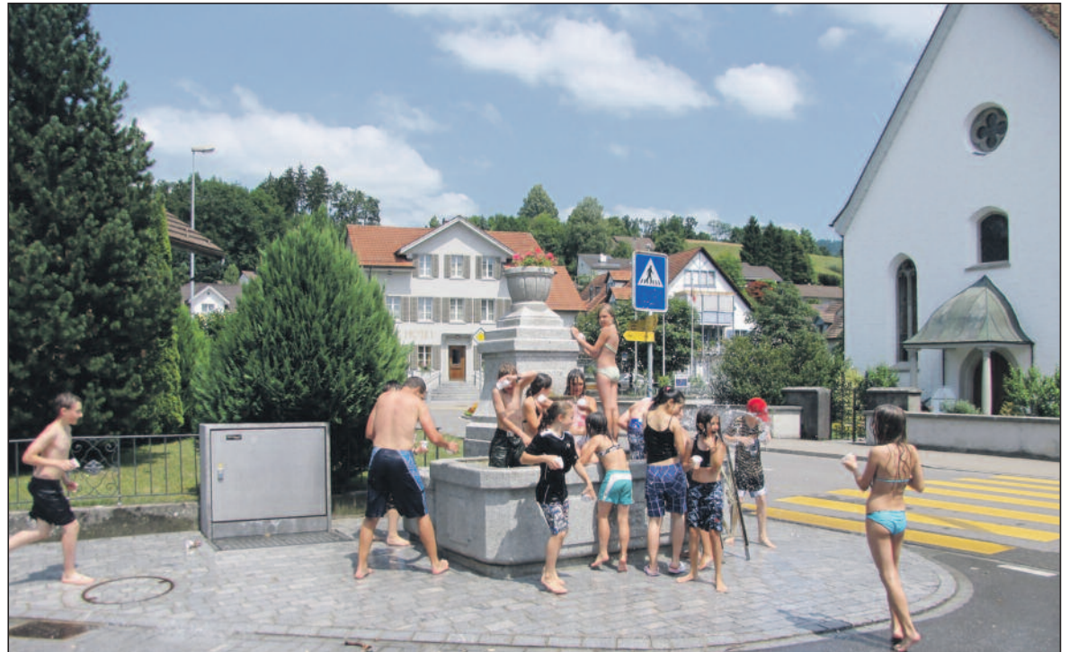
Am Dorfbrunnen ist oft Betrieb, auch wenn keine Klasse sich wie hier bei heissem Wetter erfrischt. Manchmal stillen Vorübergehende ihren Durst, oft füllen Velofahrer oder Dorfbewohner Flaschen mit dem mineralhaltigen Quellwasser.

Die Dürntner Dorfgemeinde sicherte sich irgendwann einen Teil des Wassers dieser Quelle für ihren hölzernen Brunnen gegenüber der Kirche. 1734 wird der Brunnenplatz erstmals schriftlich erwähnt. Die Wasserleitung bestand aus ausgebohrten Föhren- oder Weisstannen-Stämmen, so genannten «Tücheln». Sie wurde im Frondienst gebaut und unterhalten. Neben diesem oberen Dorfbrunnen war auch im Unter-