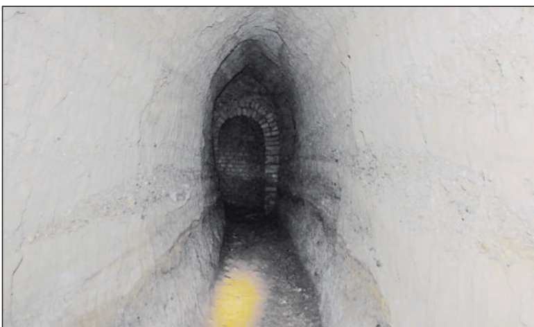
In die fest gepressten eiszeitlichen Ablagerungen (Sand mit Kieschichten) wurde 1867 der Stollen weiter in den Hang hinein gegraben und mit einer Abzweigung versehen. Hinten im Bild sieht man den Anfang des kurzen Gewölbestückes der ÜBB.

Die beiden Verantwortlichen Margrit Stark und Brigit Thalman freuen sich auf ihre Stammkunden/-innen, hoffen aber auch, neue Gesichter begrüßen zu können. Obst, Gemüse, Kräuter, Pilze usw. können jeweils am Montag und Donnerstag von 17.30 bis 18.30 Uhr gebracht werden. Eine Mithilfe beim Verteilen des Frischgutes auf die Dörrgitter ist erwünscht. Weiter Informationen sowie Anmeldung von über 10 Kilogramm Obst oder Gemüse unter Telefon