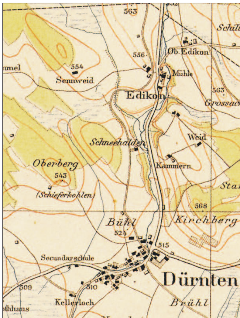
Karte aus den 1850er-Jahren. Fast zuoberst am Oberberg-Hang hatte man bis kurz vor der Erstellung dieser Karte Kohle abgebaut. Die Wald- und Riedflächen waren damals noch grösser, am Chilchberg wuchsen Reben. (Bildbearbeitung Albert Stutz)