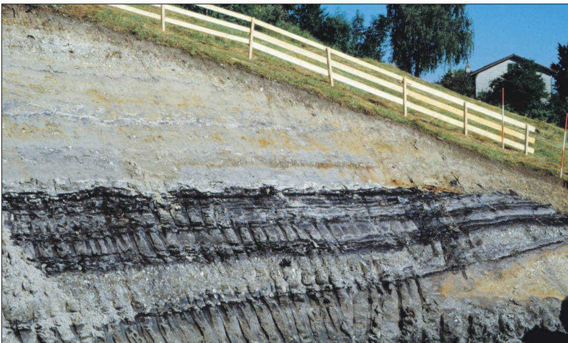
Beim Aushub einer Baugrube am Chilchberg kamen 1992 wie einst am Oberberg unter dem Gletscherschutt Kohlschichten zum Vorschein.

Beim Pflügen oder beim Graben nach Trinkwasser wurden am Oberberg Kohlschichten angeschnitten. Jeder Grundeigentümer begann auf eigene Faust, solche Kohle zu fördern, über den Sommer zu trocknen und dann im Ofen oder Herd zu verbrennen. So entstanden ungeordnet tiefe lehmige Löcher. Zum Düngen wurde auch feuchte, so genannte grüne Kohle auf den Feldern verbrannt. Die Zürcher Regierung erliess 1805 ein Gesetz über die Nutzung der Bodenschätze. Nur Torf durfte ohne staatliche Bewilligung aus dem Boden geholt werden. Trotzdem gruben viele Einwohner von Dürnten in der Not in ihren schmalen Wald- oder Wiesenstrei-